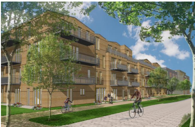
Vorläufiger Entwurf Casa Colorida in Holzbauweise