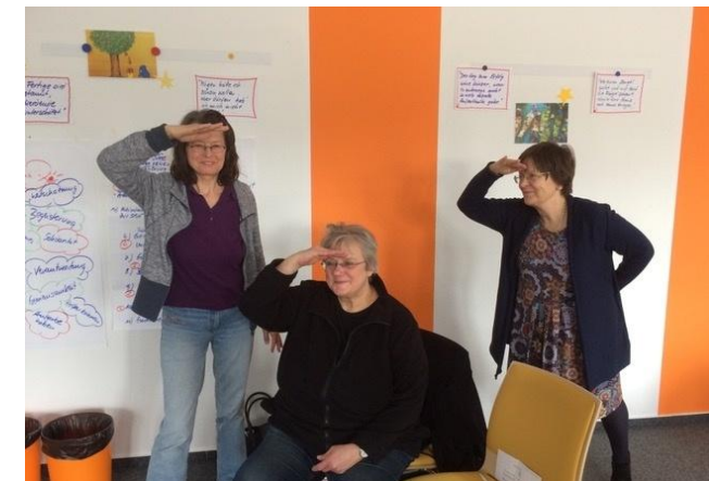
Workshop März 2019